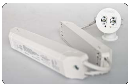
Innfelt m/trafo og batteri (R)

EloLED Mini er mindre enn de fleste downlights, men gir uovertruffen lysspredning ved hjelp av det unike Scattlight-prinsippet.