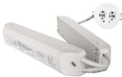
Innfelt m/trafo og batteri (R)

EloLED Mini er mindre enn de fleste downlights, men gir uovertruffen lysspredning ved hjelp av det unike Scattlight-prinsippet.